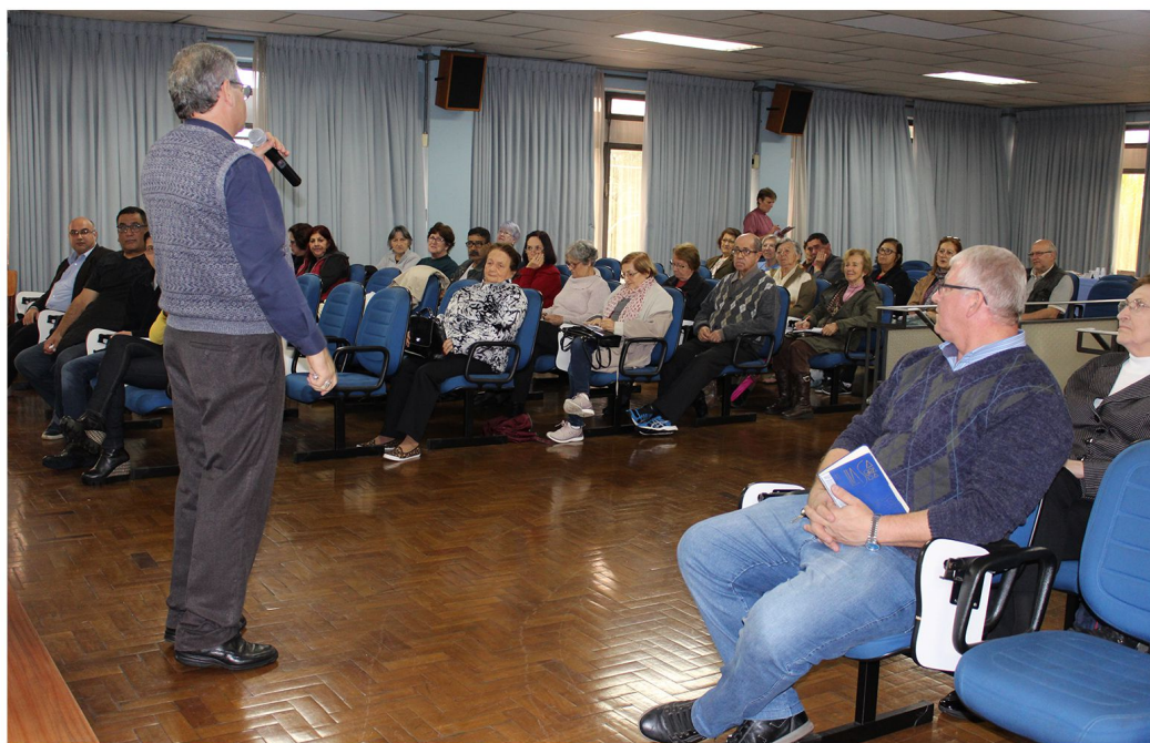
Apresentação das novas Diretrizes da CNBB para agentes sociais

desenvolvem ações semelhantes para discutir a proposta de organização das ações na região central para evitar a sobreposição de atendimentos.