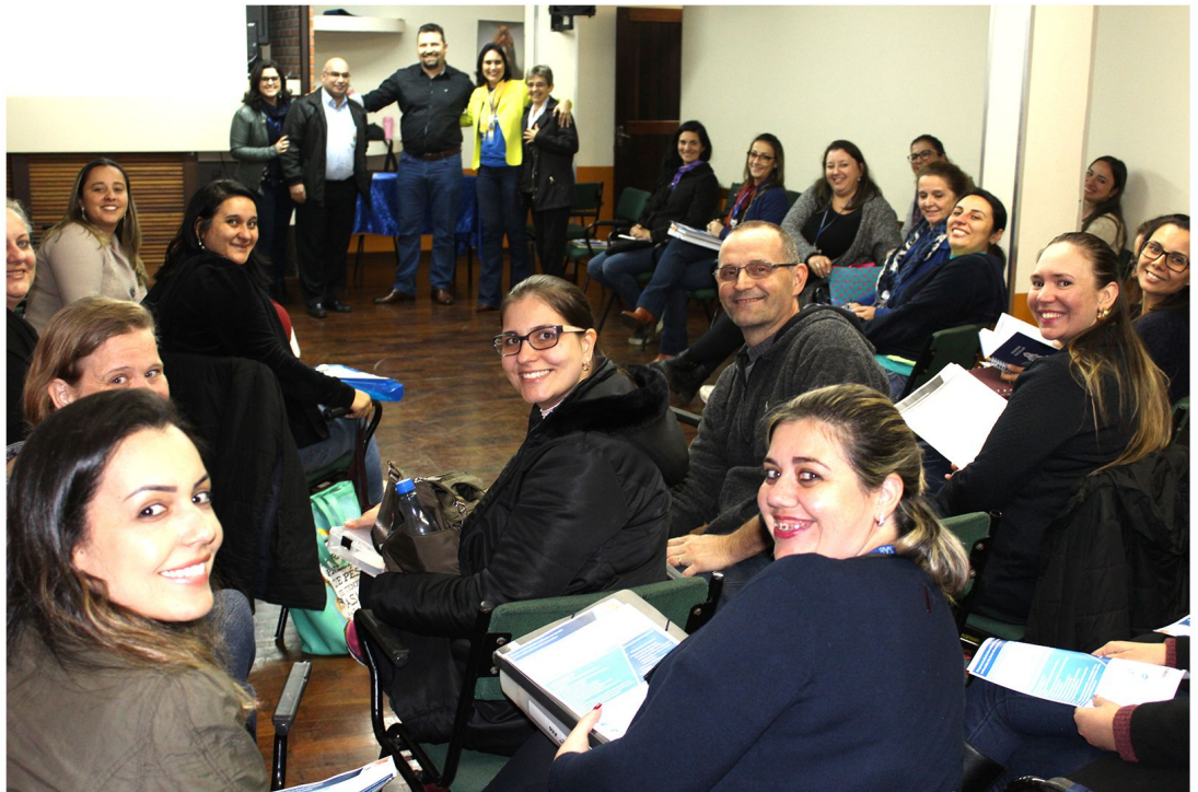
Reunião debateu parceria entre Cáritas e Escola Nossa Senhora do Brasil