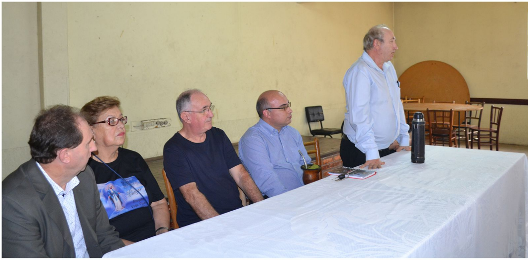
Solenidade de abertura do Curso de Corte e Costura

Vinte e quatro mulheres da cidade de Esteio passarão nove meses num processo intenso de formação profissional nas áreas de Corte, Costura e Customização. Elas pertencem a famílias assistidas pelo trabalho emergencial de distribuição de cestas básicas pelas quatro paróquias da cidade. O curso está funcionando na casa do projeto batizado como Vida Plena, que desenvolve a ação social da Paróquia Nossa Senhora das Graças.