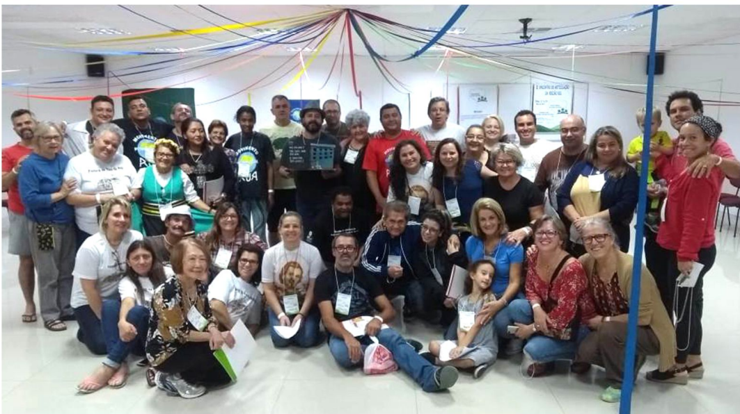
Estados do Sul debateram ações com a população de rua

Uma delegação formada por quinze pessoas da Arquidiocese de Porto Alegre participou de 17 a 19 de maio, em Florianópolis, do Seminário da Pastoral da População de Rua. O evento reuniu representações dos três Estados da Região Sul. Santa Catarina e Paraná já possuem um movimento articulado. Do Rio Grande do Sul, apenas a delegação da Arquidiocese participou do evento.