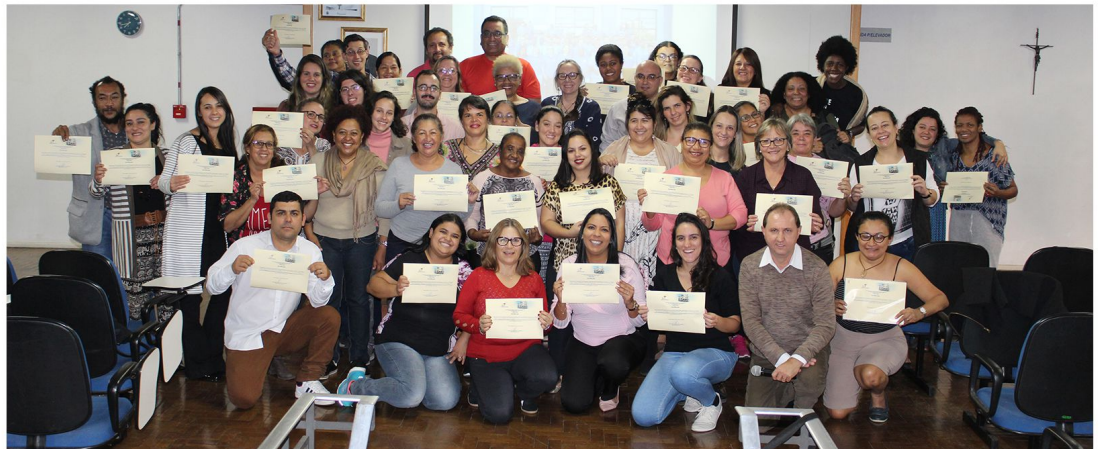
Grupo de agentes qualificados para captação de recursos a projetos sociais

Avaliação positiva destacando a qualidade do serviço e o empenho da Cáritas Arquidiocesana com seu programa de formação para qualificar a rede socioassistencial. Estes foram os destaques apresentados pelos participantes do Curso de Interpretação de Editais e Elaboração de Projetos de Captação de Recurso, ofertado entre os dias 03 a 07 de junho para agentes sociais e entidades assistenciais. Este curso qualificou 67 agentes sociais e dirigentes de entidades de assistência social.