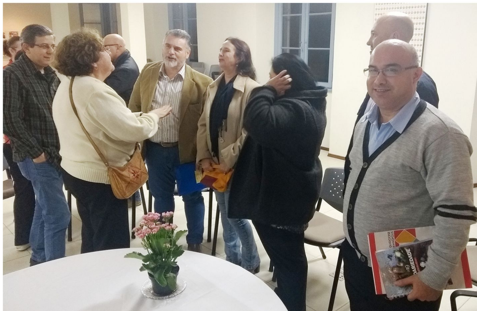
Entidades debateram processo de integração

Um dos encaminhamentos da reunião foi a continuidade do processo de aproximação, conhecimento e integração dos grupos e entidades que atendem a população em situação de rua tanto no centro histórico, quanto nos bairros. Diante da existência de muitos grupos que distribuem alimento na região central, algumas organizações já estão se preparando para descentralizar esse atendimento, atendendo nos bairros mais afastados do centro.