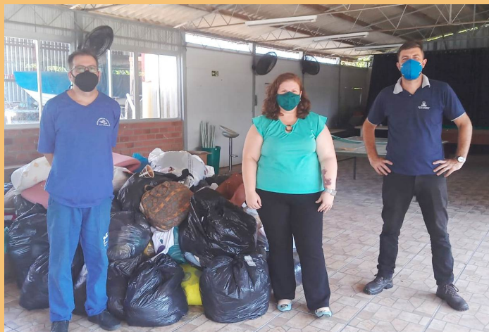
Centro Social Marista recebeu as doações

O Mensageiro da Caridade tem a missão de promover a ajuda para a população vulnerabilizada e mediar ações de solidariedade. Uma ação cooperativa foi realizada com apoio da entidade entre a Paróquia