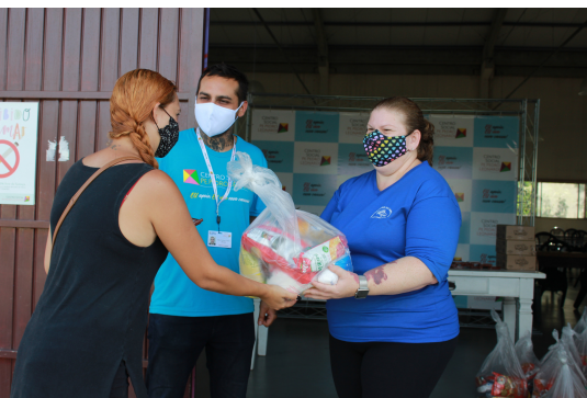
Famílias da comunidade receberam cestas básicas

Nesta comunidade, a taxa de analfabetismo é de 4,28% da população e o rendimento médio dos responsáveis por domicílio é de 1,76 salário mínimo. A renda média do por habitante é de aproximadamente R$ 469,17, menos de um terço da renda média dos habitantes da cidade de Porto Alegre. A pandemia agravou ainda mais a condição socioeconômica, porque foi uma das comunidades mais impactadas pelo desemprego.