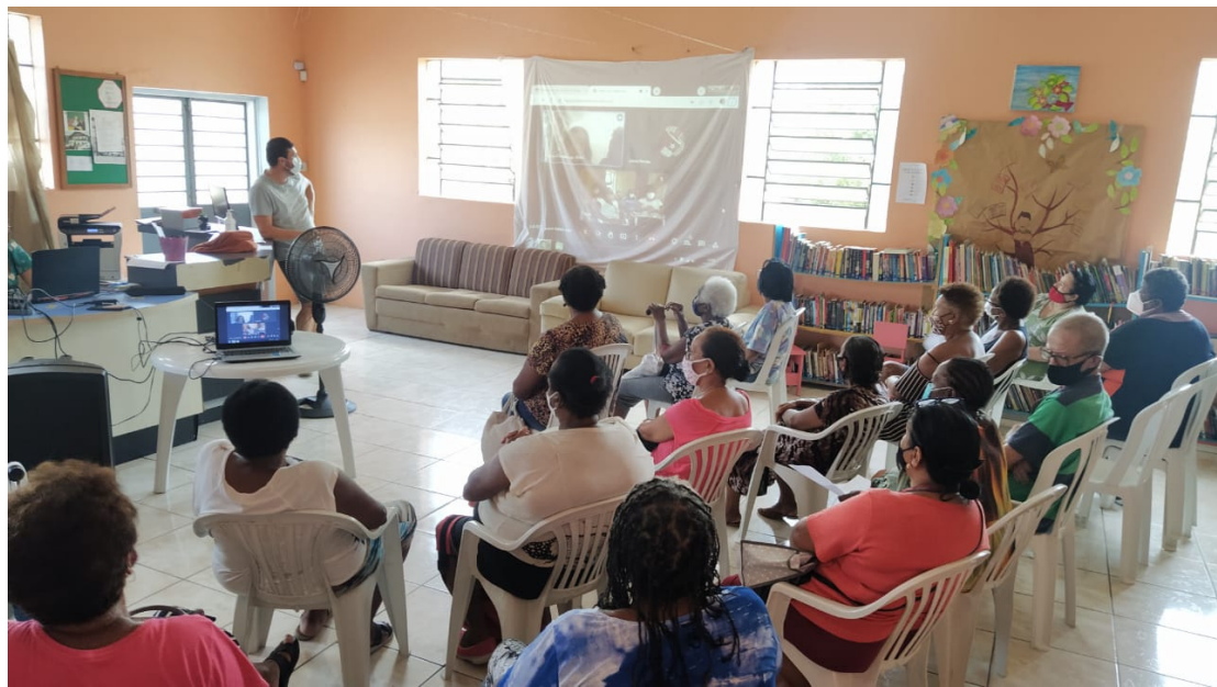
Encontro apresentou história e obra de Chiquinha Gonzaga

Durante o ano, a parceria vai utilizar a escrita e a leitura como ferramentas amigáveis na reelabo-