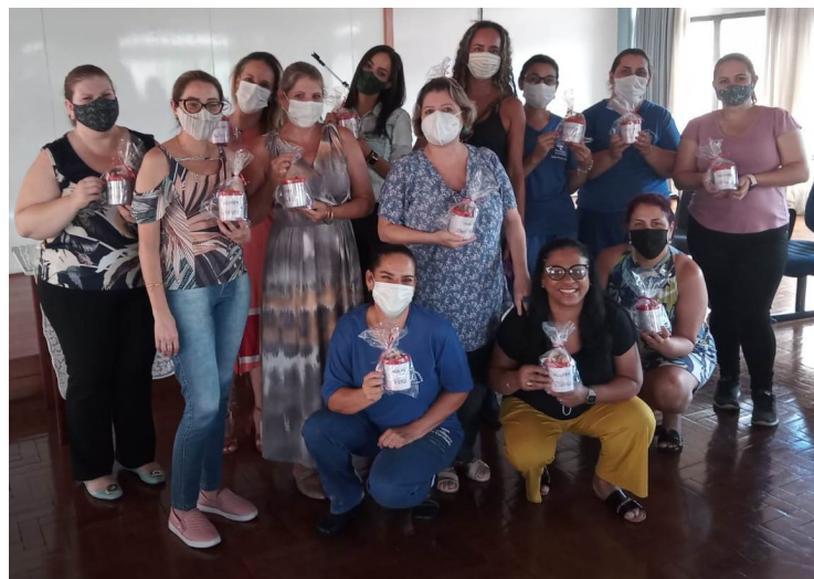
Atividade aconteceu no Salão de Eventos da entidade

Como forma de carinho e gratidão, ao final da confraternização, cada colaboradora recebeu da instituição um presente personalizado identificando a sua participação na vida e no trabalho do Mensageiro da Caridade.