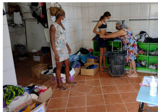
Serviço contínuo de auxílio às famílias

rado e organizado para que este serviço possa funcionar durante todo o ano no auxílio às pessoas em situação de vulnerabilidade. "A doação de roupa é uma ação com duplo benefício: quem necessita e recebe e quem doa, porque pratica a solidariedade com o excedente que possui". Ele destaca que a doação de roupa é um ato aparentemente simples, mas com um significado profundo, pois auxilia a quem não dispõe do básico para viver com dignidade.