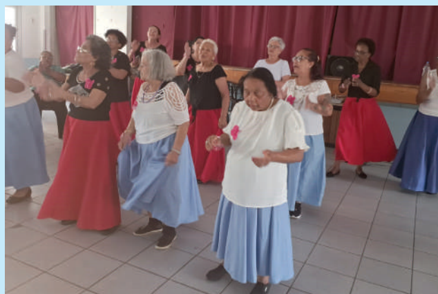
Apresentações reafirmaram o gosto pela arte