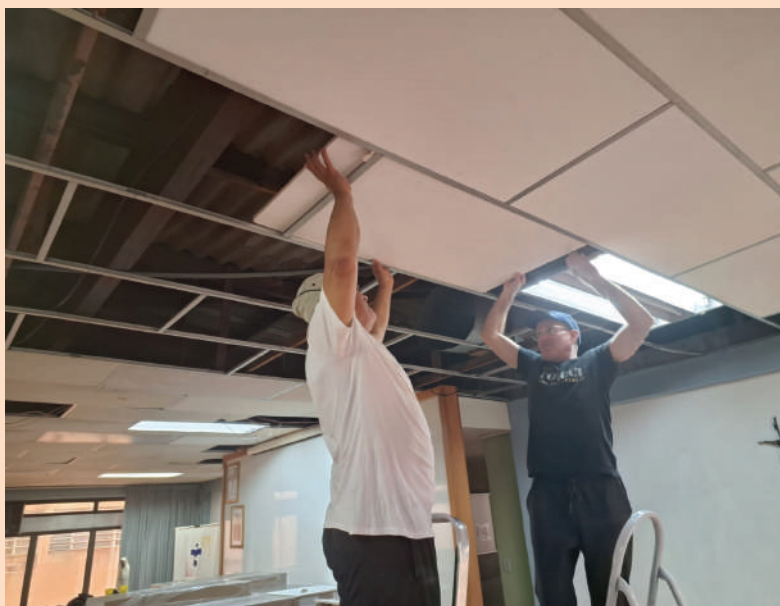
Recursos públicos aplicados na melhoria dos espaços de serviço