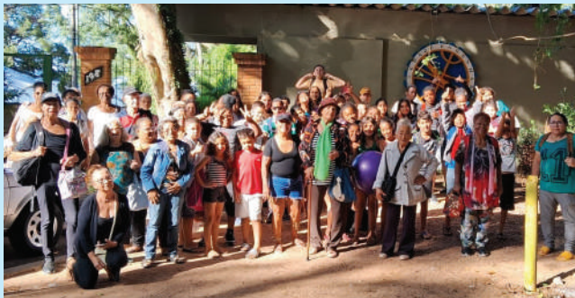
Atividade realizada na Sociedade de Engenharia do RS

Crianças e adolescentes em situação de vulnerabilidade social, que são atendidos pelo Centro Social Pe. Irineu Brand amenizaram o incômodo calor, em um período que as temperaturas passam dos 30 graus em Porto Alegre. Elas foram para a Sociedade de Engenharia do Estado do Rio Grande do Sul, no dia 22 de fevereiro, passar o dia na piscina e confraternizar com um almoço coletivo fornecido pelo Centro Social. A atividade integrou o projeto Verão do Centro Social desenvolvido nos meses de janeiro e fevereiro, de segunda a sexta-feira, em dois turnos de atividades.