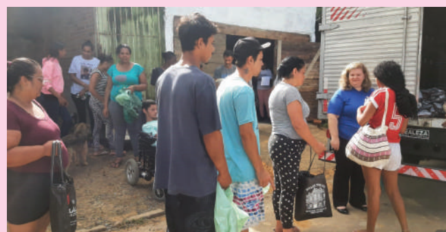
Entrega de alimento na Vila São Tomé