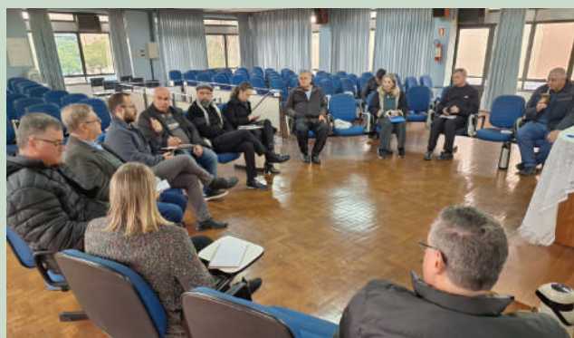
Padres e equipe do Mensageiro da Caridade detalharam plano de auxílio