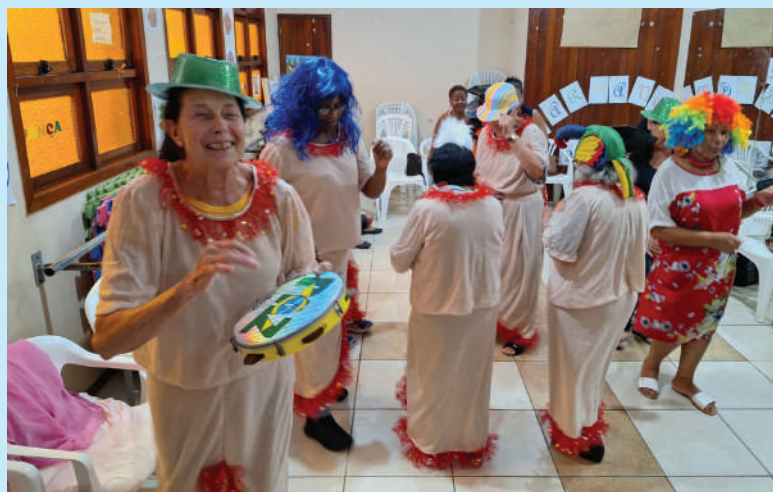
Mulheres celebraram a data com alegria