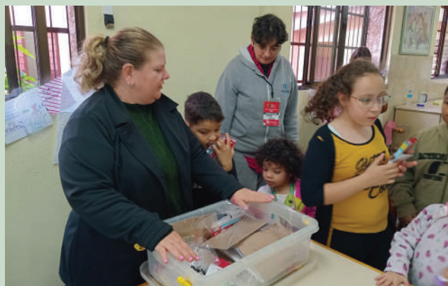
Gesto de solidariedade emocionou crianças em abrigos

entregues a crianças em diversos abrigos. Um deles instalado na Escola Frei Pacífico acolheu crianças autistas.