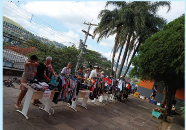
Distribuição de roupa beneficiou famílias afetadas pelo temporal