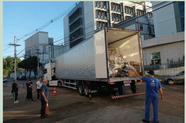
Carreta da Curitiba transportou solidariedade paranaense