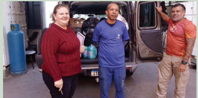
Auxílio para o atendimento da população em situação de rua

do Arroio Cavalhada tiveram que deixar suas casas em razão dos alagamentos. As famílias receberam alimento, material de higiene pessoal, fraldas infantis e produtos de limpeza.