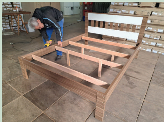
Montagem realizada no Mensageiro da Caridade

Para viabilizar a distribuição foi fundamental a organização da caridade das paróquias. Esta rede de emergência foi integrada por 34 paróquias das cidades de Porto Alegre, Canoas, Esteio, Alvorada, Eldorado do Sul e Guaíba. Somente nessa estratégia foram distribuídos 3.067 itens para reequipar as residências. Um atendimento expressivo aconteceu também diretamente na sede da entidade, a partir de encaminhamentos feitos por paróquias, entidades assistenciais e organizações da rede socioassistencial. A projeção é de de atendimento a 2.650 famílias com a mobilização de recursos realizada pelo Mensageiro da Caridade. Todos os bens distribuídos foram adquiridos de empresas gaúcha para colaborar com a retomada da economia regional e a manutenção de empregos na indústria do Estado.