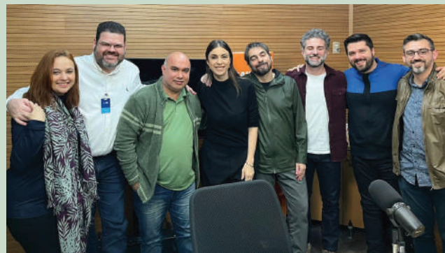
Lançamento de campanha realizado na Rádio Gaúcha