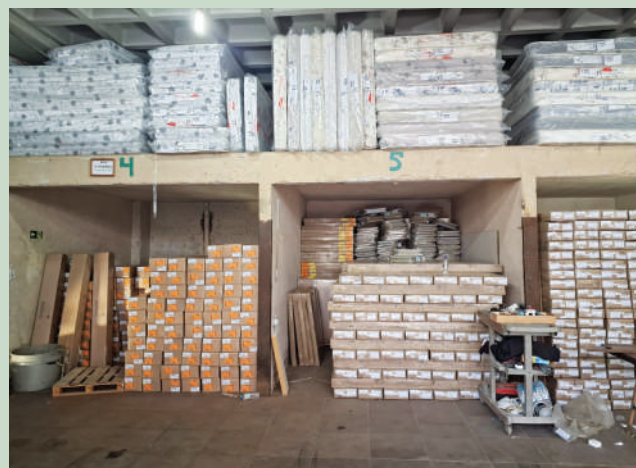
Estoque de móveis na sede da entidade

Campos destaca que o atendimento das demandas nessa fase de reconstrução justifica esse importante investimento, a fim de pro-