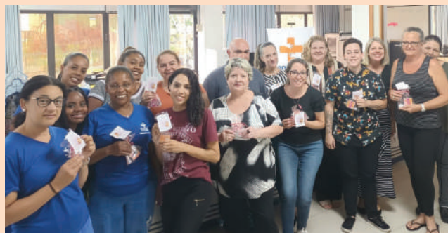
Servidoras da entidade receberam homenagem