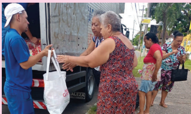
Ação atendeu muitos idosos e pessoas com deficiência

As famílias em situação de vulnerabilidade social da Zona Sul de Porto Alegre foram be-