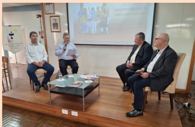
Evento destacou a importância da Amizade Social