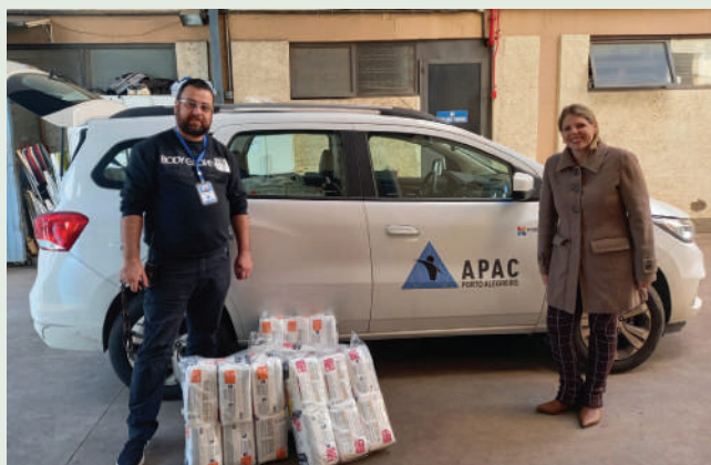
Auxílio chegou às famílias de apenados

Um dos parceiros foi a entidade Sol Maior , que desenvolve projetos de proteção e promoção social voltados para crianças e adolescentes em situação de vulnerabilidade. As famílias das crianças foram duramente atingidas pela enchente. O Mensageiro da Caridade repassou para a entidade alimentos não perecíveis para evitar que as crianças ficassem desassistidas.