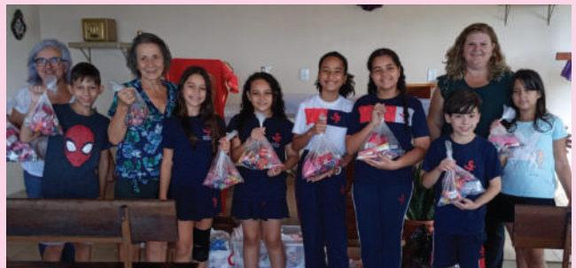
Serviço atende todas as faixas do ciclo vital