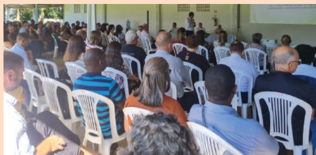
Atividade aconteceu no Seminário de Gravataí