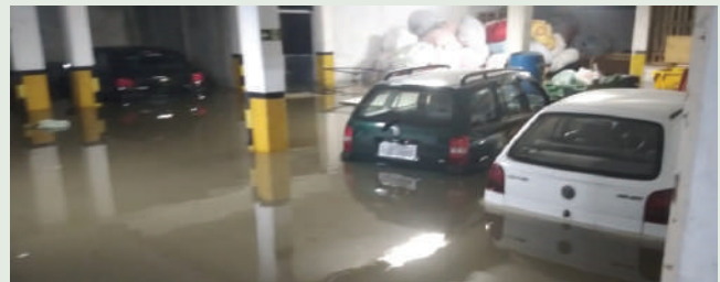
Depósito foi inundado em janeiro

A sede do Mensageiro da Caridade foi duramente afetada. Os veículos de serviço ficaram submersos e sofreram grandes avarias. Roupas calçadas e utensílios domésticos que estavam depositados para serem destinados a famílias afetadas por situações emergenciais