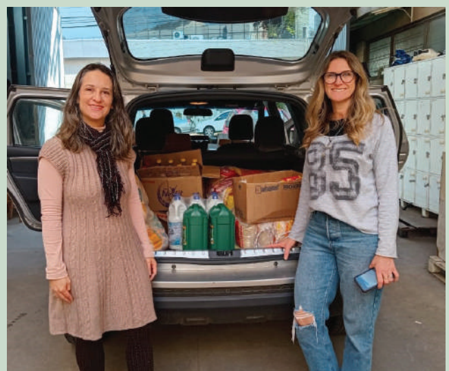
Entidade Sol Maior atende crianças no centro da Capital

Um frenético vai e vem de carga e descarga de roupas, agasalhos, alimentos não perecíveis, material de higiene e produtos limpeza logo se instalou na sede da entidade e nos entrepostos instalados para receber os donativos e repassar aos diversos operadores dessa grande rede.