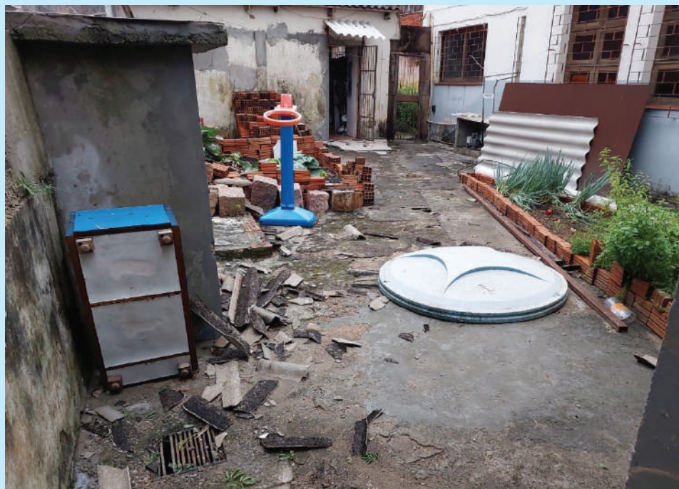
Tempestade causou estragos na estrutura do Centro Social

O ano de 2024 iniciou com ocorrência que antecipou os inúmeros desafios para as atividades do Centro Social Pe. Irineu Brand. A unidade que atende à população da Vila Maria da Conceição também registrou danos expressivos, com o temporal que ocorreu em Porto Alegre no dia 16 de janeiro. Telhado, calhas e fiação elétrica do Centro Social Pe. Irineu Brand foi afetada. As atividades foram interrompidas e houve perda de alimento e equipamentos. Essa situação impediu o atendimento a crianças, adolescentes e idosos que participam do serviço de convivência e das atividades socioeducativas por duas semanas.