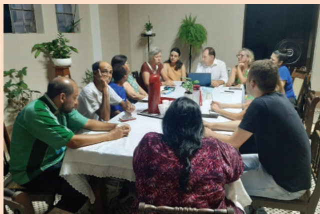
Encontro realizado na sacristia da Catedral Metropolitana