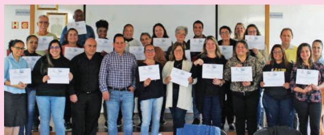
Formação ofereceu suporte para sustentabilidade das organizações

O Mensageiro da Caridade realizou de 15 a 18 de abril o Curso Intensivo de Elaboração de Projetos de Captação de Recursos. Os participantes receberam informações sobre a interpretação correta de editais e assimilaram a técnica de elaboração de projetos. O programa de qualificação assessorado pelo jornalista Elton Bozzetto qualificou 21 novos captadores de recursos para entidades, paróquias e organizações da sociedade civil que desenvolvem projetos sociais.