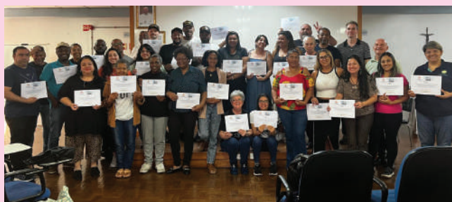
Proposta visa qualificar a gestão das entidades

Na última semana de outubro, o Mensageiro da Caridade realizou o Curso de Coordena-