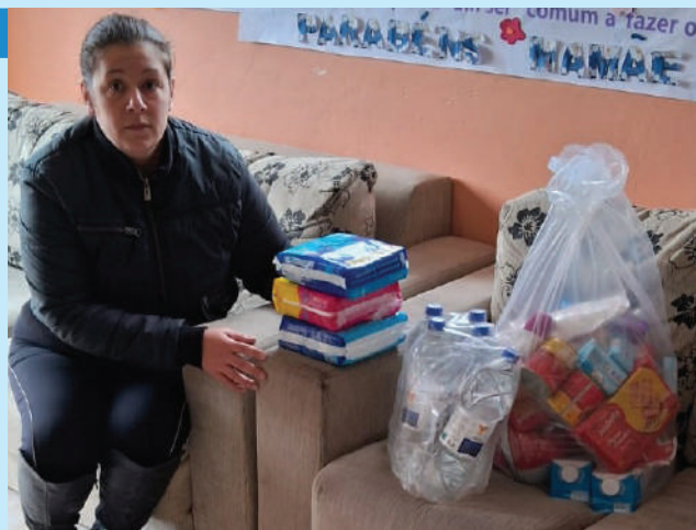
Famílias acolhedoras receberam auxílio alimentar