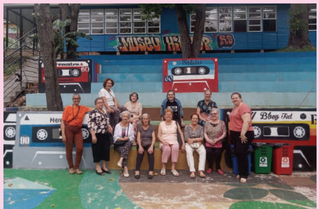
Visita guiada para conhecimento de arte popular