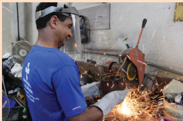
Atividade contribui para uso racional dos bens naturais