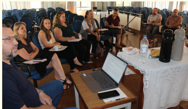
Diálogo realizado no Salão de Eventos do Mensageiro da Caridade

A Secretária Regional destacou a consistência da ação realizada pelo Mensageiro da Caridade "e a importante incidência da entidade junto à rede socioassistencial em temáticas relacionadas à criança e adolescente, migran-