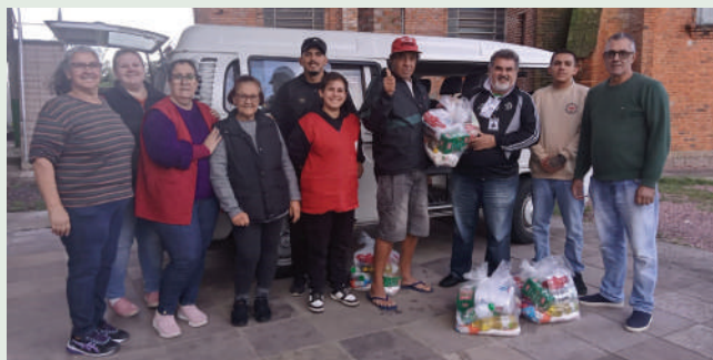
Repasse de alimento para abrigo de Migrantes

MIGRANTES – Os migrantes também foram beneficiados pela ação de socorro emergencial do Mensageiro da Caridade. Uma parceria entre a entidade e o CIBAI Migrações repassou auxílios para migrantes e refugiados que tiveram de deixar suas casas e ficaram desassistidos. Eles foram abrigados no Salão da Paróquia Nossa Senhora de Pompeia, no Bairro Floresta. No grupo estavam algumas famílias de afegãos que vivem em Porto Alegre.