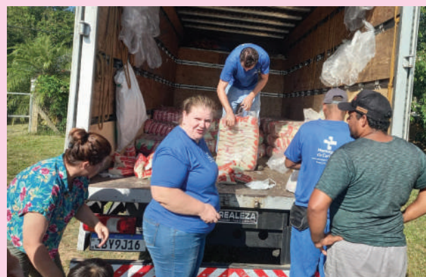
Ação garante segurança alimentar