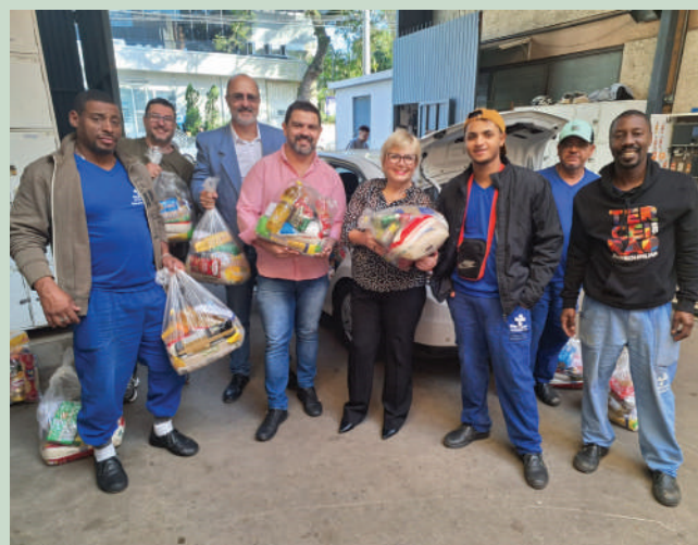
Amor concretizado em solidariedade

SARANDI – Uma das regiões da Capital mais afetadas pela enchente foi o bairro Sarandi, na Zona Norte. Conforme os dados oficiais, foram 26 mil pessoas flageladas. O caminhão do Mensageiro da Caridade levou as doações e foi realizada a entrega diretamente para as famílias necessitadas. O principal item distribuído foi água, porque em muitas regiões o abastecimento público deixou de funcionar.