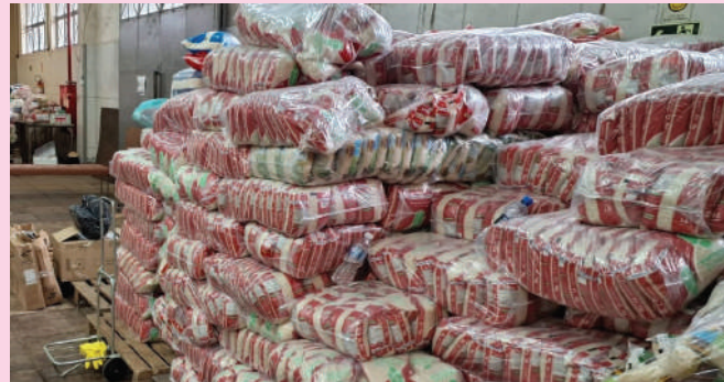
Ação de segurança alimentar beneficia mais de seis mil famílias

A superação da fome foi uma das ações permanentes de 2024. O programa do Arroz deu suporte importante para garantir alimento a 6.210 famílias. Com apoio da Fundação Incobrasa foram distribuídas 528 toneladas do produto. Em razão da estrutura de capilaridade, o alimento chegou à mesa das famílias que estão em elevado grau de vulnerabilidade em 14 municípios da Região Metropolitana. A entidade recebeu também nove(9) toneladas de feijão, repassadas pelo doador Antônio Migliorini, que integrou a composição das cestas básicas distribuídas às famílias pobres.