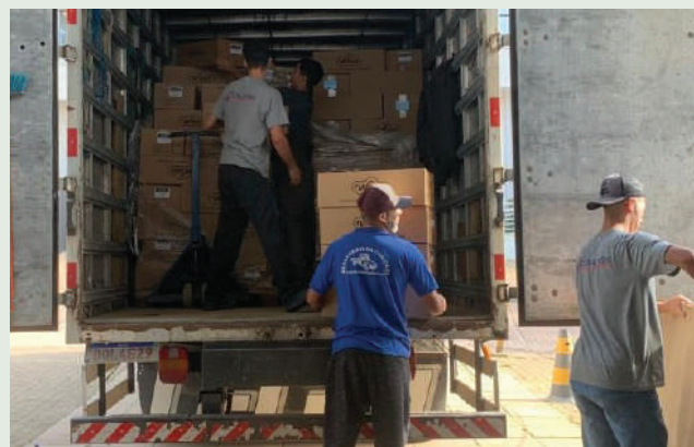
Alimento facilitou o socorro às famílias

PANETONES – A solidariedade com o povo gaúcho se expressou de muitas formas. A empresa que produz doces e chocolates Weissburg de Campina Grande do Sul/PR entregou ao Mensageiro da Caridade uma carga de panetones. O empresário paranaense fez o repasse com o intuito de facilitar a alimentação das famílias flageladas, em razão da falta de condições para cozinhar em muitas regiões alagadas.