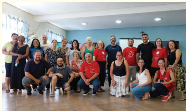
Lideranças estaduais alinharam ações de 2024