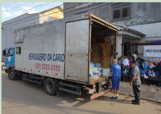
Socorro chegou numa das regiões mais atingidas da Capital

APAC – A Associação de Proteção e Assistência aos Condenados de Porto Alegre (APAC), que tem sua unidade instalada nas proximidades do Presídio Central abrigou famílias de apenados que tiveram suas casas alagadas ou arrastadas pela enchente. Foram mais de oitenta pessoas acolhidas. Eles receberam roupas, fraldas geriátricas e material de limpeza. As doações deram suporte ao acolhimento dos flagelados.