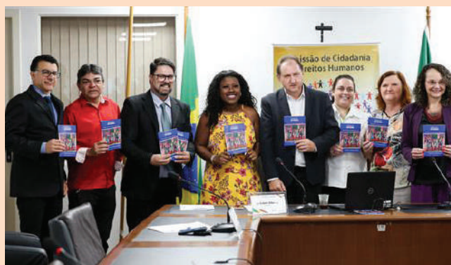
Solenidade realizada na Assembleia Legislativa

Crianças e adolescentes filhos de migrantes que frequentam o ensino público estadual no Rio Grande do Sul poderão se comunicar no ambiente escolar na língua de origem. Essa possibilidade será dada com o “Manual Integra”. O documento pedagógico foi entregue nesta 6 de fevereiro, pelo Mensageiro da Caridade, Fórum Permanente de Mobilidade Humana do RS e Comissão de Cidadania e Direitos Humanos da Assembleia Legislativa ao Governo do Estado do Rio Grande do Sul, durante evento na Assembleia Legislativa. A publicação tem tradução em cinco línguas – português, espanhol, francês, creole haitiano e inglês – de expressões utilizadas para comunicação cotidiana como saudações, informações