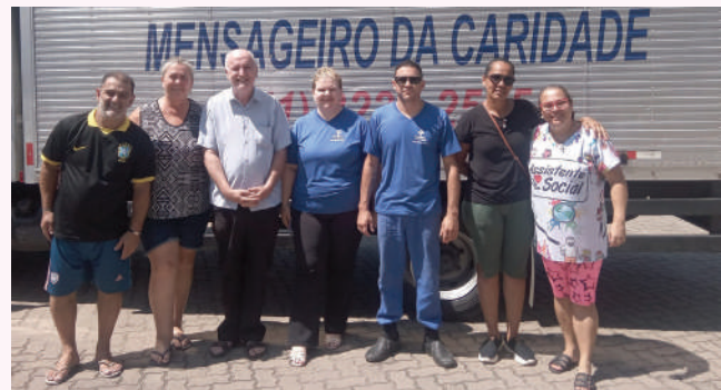
Equipe que atuou na entrega do alimento