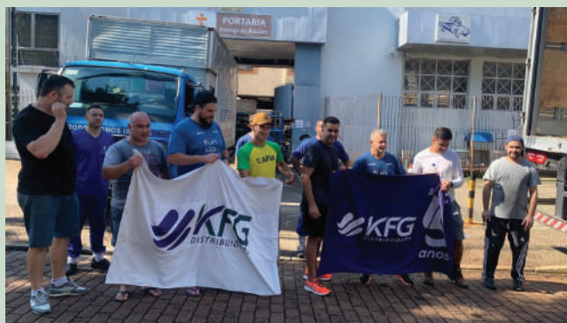
Empresa catarinense mobilizou a comunidade para doação

No dia 6 de maio, a entidade recebeu o primeiro carregamento de fora do Estado. A empresa KFG Distribuidora de Santa Catarina doou uma carreta com 28 paletes de água mineral". Os primeiros carregamentos foram destinados para os locais de acolhimento às famílias desabrigadas como a Paróquia Santa Rosa de Lima, a Escola São Francisco na Zona Norte e para a Paróquia Nossa Senhora Desatadora de Nós, no bairro Umbu, em Alvorada. Além de água, foram destinados para esses locais colchões e cobertores, a fim de auxiliar na montagem dos espaços de acolhimento.