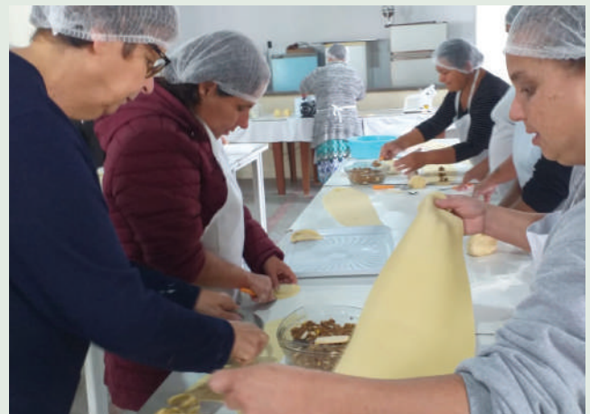
Equipe da Paróquia produziu alimento para os flagelados

CENTRO POP - A entidade também auxiliou o Centro Pop I que faz o atendimento à população em situação de rua. Foram repassados itens de alimentação, roupas masculinas, material de limpeza e produtos de higiene pessoal.