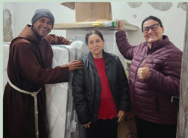
Moradora de Canoas manifesta gratidão

abrigo público ele e a esposa retornaram para a casa, que foi inundada com mais de 1,80m de água. "Perdi fogão, geladeira, móveis. Só saímos com a roupa do corpo". Ele recebeu vários itens para reorganizar a vida da família. "Essa ajuda do Mensageiro da Caridade vai fazer uma grande diferença, porque vai servir para recomeçarmos nossa vida".