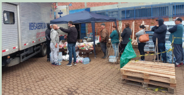
Famílias da Zona Norte receberam apoio

SARANDI – O Mensageiro da Caridade auxiliou também na recuperação de algumas estruturas. Uma equipe de servidores fez a limpeza das dependências da Paróquia Santa Catarina, no Bairro Sarandi. A região foi totalmente alagada e todo o atendimento social e religioso na paróquia foi interrompido. Com a limpeza foi possível retomar o atendimento à população e apoiar as vítimas da tragédia no processo de retorno e reconstrução.